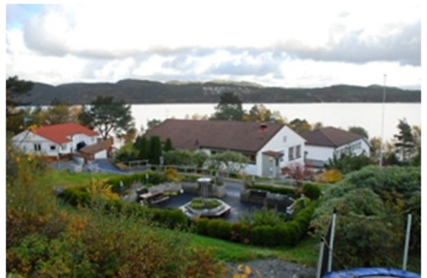
SOLVIK PÅ ASKØY