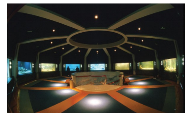
Rotunden, selmating og selshow i Akvariet,