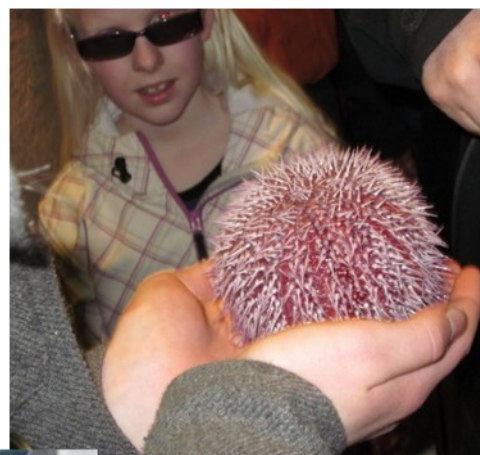
Kråkebolle i NFFA sine hender