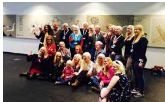
Figur 1 Deltakere på årets YPA

Tilbakemeldingene til arrangementet fra ungdommene var at de opplevde et felleskap fullt av likheter på tvers av landegrenser, mange nye opplevelser og flere nye venner.