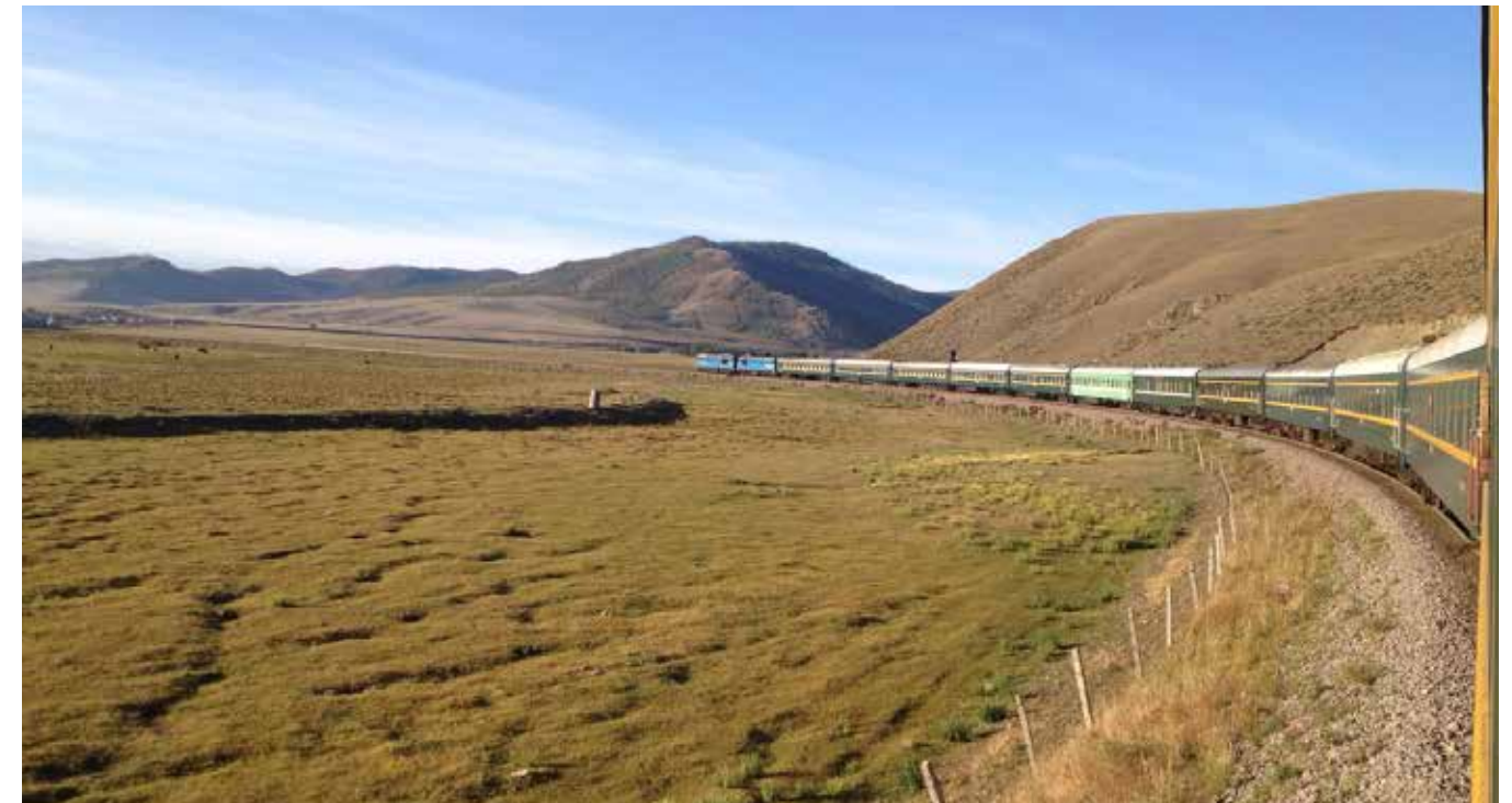
Vårt lange tog med stø kurs over det mongolske høylandet

Jeg ser fram til å se dere alle igjen neste år på Hafjell.