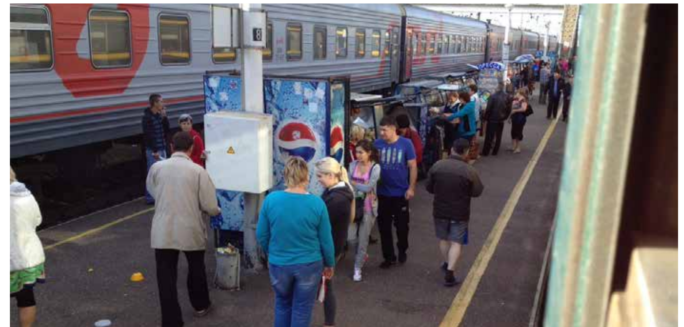
Marked på perrongen i Balezino (Russland)