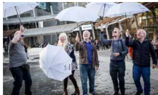
Figur 2 White Umbrellas